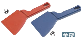
バーキンタ 2 エッジスパチュラ

材質:ポリプロピレン(鉄粉配合) 耐熱温度:80°C ●金属検出機で検出できる樹脂製のスパチュラです。 ※金属検出機の設定、製造されている食品の種類や形状等により検出可能な樹脂片の大きさが異なります。