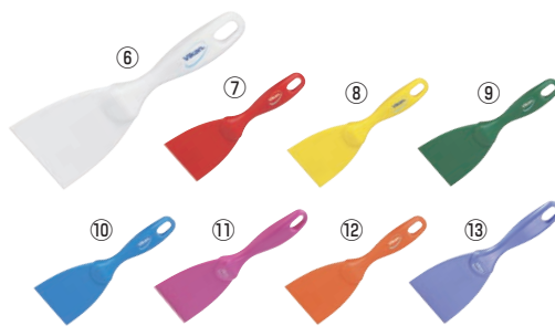
ヴァイカン ハンドスクレーパー 小 4060