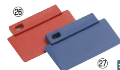
バーキンタ 3 エッジスパチュラ

幅100×全長240 材質:ポリプロピレン(鉄粉配合) 耐熱温度:120°C ●金属検出機で検出できる樹脂製のスパチュラです。 ※金属検出機の設定、製造されている食品の種類や形状等により検出可能な樹脂片の大きさが異なります。