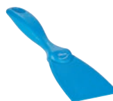
⑲ ヴァイカン MDS ハンドスクレーパー