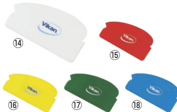
ヴァイカン オリジナルスクレーパー