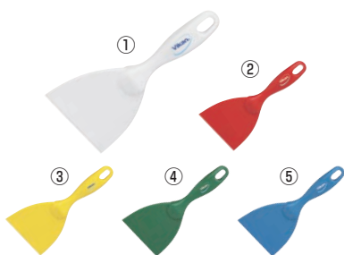
ヴァイカン ハンドスクレーパー 大 4061